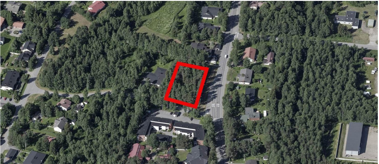
Kuva 1. Ilmakuva suunnittelualueesta, suunnittelualue rajattu punaisella viivalla