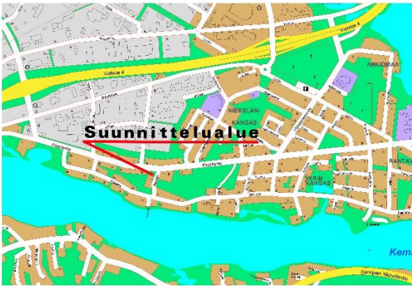
Kuva 2. Suunnittelualueen sijainti.

Osallistumis- ja arviointisuunnitelmassa (MRL 63 §) kuvataan kaavatyön tavoitteet ja lähtökohdat, valmistelun ja päätöksenteon eteneminen, kaavan vaikutusten arviointitavat sekä osallistumismahdollisuudet ja tiedottaminen. Osallistumis- ja arviointisuunnitelmaa päivitetään kaavatyön eri vaiheissa tarvittaessa.