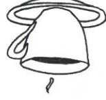
Kuva 1