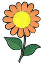
Kuva 1