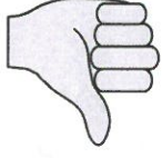
Kuva 1