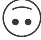
Kuva 1 Tuija Heikö/papu.net