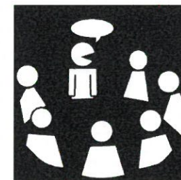
Kuva 4

Osallisuusryhmätoiminnasta järjestetään kaikille asiasta kiinnostuville info – ja keskustelutilaisuus keskiviikkona 4.9.2019 klo 15.00 -16.15 Erkkilänkujan päivätoimintakeskuksessa (Erkkilänkuja 1-3).